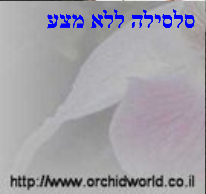
סלסילה ללא מצע