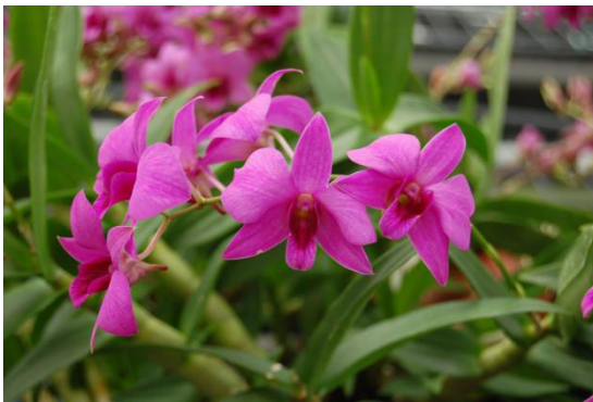
דנדרוביום משתלת סולו-שתיל

פריחה שונים הצליחו במשתלה להגיע לעציצים פורחים כמעט כל השנה, ובכך ייחודם. הצמחים מיוצאים להולנד בכמה ערוצי שיווק ונמכרים גם בשוק המקומי.